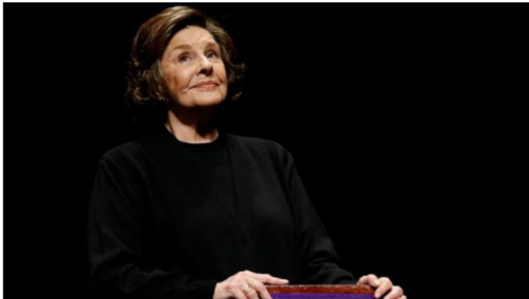
Lola Herrera se despedirá con una gira de "Cinco horas con Mario"

Casi 40 años después de haber interpretado por primera vez a Carmen Sotillo en "Cinco horas con Mario", la actriz Lola Herrera encarnará por última vez este papel en una gira de despedida que comenzará en Córdoba en abril de 2018, desde donde recorrerá España.