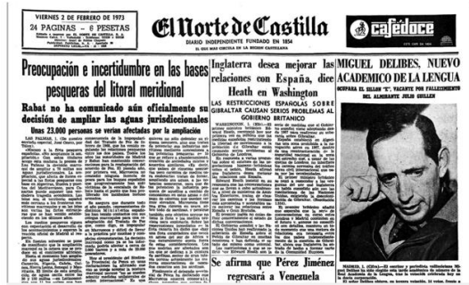
Primera página de El Norte con la elección de Miguel Delibes como nuevo académico de la lengua en febrero de 1973.

El escritor y periodista vallisoletano se impuso en la votación al poeta José García Nieto el 1 de febrero de 1973