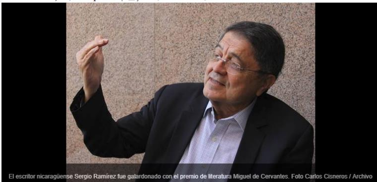
El escritor nicaragüense Sergio Ramírez fue galardonado con el premio de literatura Miguel de Cervantes.

Armando G. Tejeda, corresponsal | jueves, 16 nov 2017 08:04