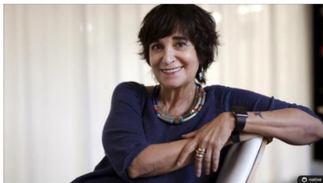
La escritora Rosa Montero.

Al final ha marcado el número con el miedo en el cuerpo. "Llevamos una temporada tan dura de muertes de amigos y malas noticias que cuando me han dicho que el ministro quería hablar conmigo, le he llamado asustada", cuenta la escritora Rosa Montero . Pero lo que Íñigo Méndez de Vigo, ministro de Cultura, quería anunciarle no era ningún hecho luctuoso, sino el dictamen del jurado del Premio Nacional de las Letras , que este año ha decidido premiar su "larga trayectoria novelística, periodística y ensayística, en la que ha demostrado brillantes actitudes literarias", según reza el veredicto. La sorpresa de lo inesperado, advierte la autora, redobla la alegría del galardón.