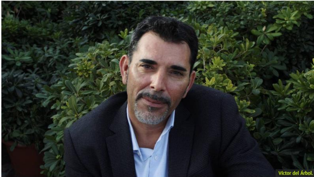
Víctor del Árbol.

Víctor del Árbol publica nueva novela y habla de su nombramiento como Caballero de las Letras y las Artes de la Academia francesa. Se posiciona en contra del 1-O.