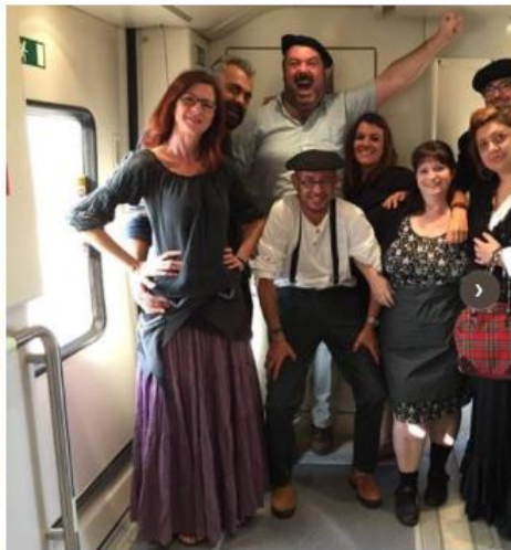
Plataforma Milana Bonita en su viaje Plasencia-Madrid.