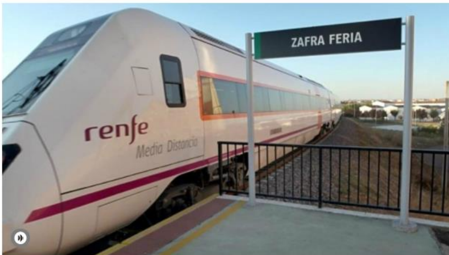
Imagen de un tren de Renfe de Media Distancia en el apeadero de Zafra FERIA en la localidad pacense de Zafra.

Los miembros de la plataforma 'Milana bonita' viajarán a Madrid en tren caracterizados como los personajes de 'Los Santos Inocentes' y realizarán un espectáculo teatral en Atocha