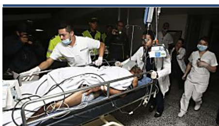
Estado de los supervivientes del Chapecoense ACTUALIZADO (http://www.mundodeportivo.com/futbol/20161129/412252580228/la-lista-de-supervivientes-del-accidente-aereo-del-chapecoense.html?utm_source=lavanguardia.com&utm_medium=outbrain&utm_campaign=widget_outbrain)