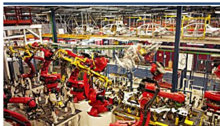
¿Los coches de Tesla también se fabricarán solos? (http://www.lavanguardia.com/motor/actualidad/20161130/412140727862/tesla-grohmann-engineering.html)