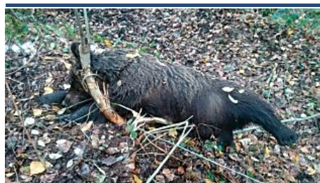
Una osa muere estrangulada por una trampa ilegal en León (http://www.lavanguardia.com/natural/20161128/412220275912/oso-pardo-estrangulado-trampa-lazo-cariseda-leon.html)

(http://www.outbrain.com/what-is/default/es)