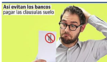
Así afectará a los perjudicados por las cláusulas suelo la decisión del Tribunal... IDEALISTA HIPOTECAS (https://www.idealista.com/news/finanzas/hipotecas/2016/06/08/742411-las-artimanas-de-los-bancos-para-no-devolver-lo-que-han-cobrado-de-mas-por-la-clausula)