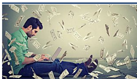
Cómo ganar dinero con un blog (https://ad.doubleclick.net/ddm/trackclk/N297201.186294OUTBRAININC/B9955110.133882284;dc_trk_aid=306543147;dc_trk_cid=71900646;dc_lat=;dc_rdid=;tag_for_child_directed_treatment=? https://www.1and1.es/digitalguide/online-marketing/vender-en-internet/como-ganar-dinero-con-un-blog/?utm_medium=cpc&utm_source=outbrain&utm_campaign=outbraintraffic&utm_term=5566922&utm_content=C%C3%B3mo+ganar+dinero+con+un+blog&ac=OM.WE.WEo50K361336T7073a)