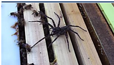
YouTube: Así terminó una araña que atacó una colmena de abejas (http://www.lavanguardia.com/natural/anim-aladas-videos/20161128/412221526871/youtube-arana-colmena-abejas.html)