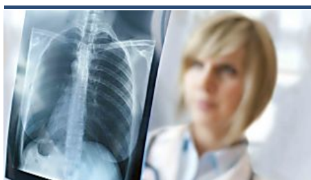
Expertos aseguran que existe una relación directa entre el consumo de tabaco y el... MD ANDERSON CANCER CENTER MADRID (http://www.mdanderson.es/sobre-nosotros/servicios-y-unidades-multidisciplinares/neumologia/consulta-de-deteccion-precoz-cancerpulmon? http://www.mdanderson.es/sobre-nosotros/servicios-y-unidades-multidisciplinares/neumologia/consulta-de-deteccion-precoz-cancerpulmon)