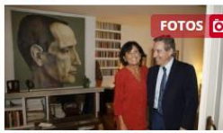
■ Iñaki Gabilondo inaugura el ciclo 'Cronistas del siglo XXI'

Así abrió el ciclo 'Cronistas del siglo XXI', organizado por la Fundación Miguel Delibes, en un acto en el que conversó con Angélica Tanarro, redactora jefe de Culturas de El Norte de Castilla. Se presentó como un hombre apasionado por el aquí y el ahora y, apelando a su edad, animó a vivir en tres dimensiones: «el presente, con consciencia total, proyectándose hacia el futuro y teniendo