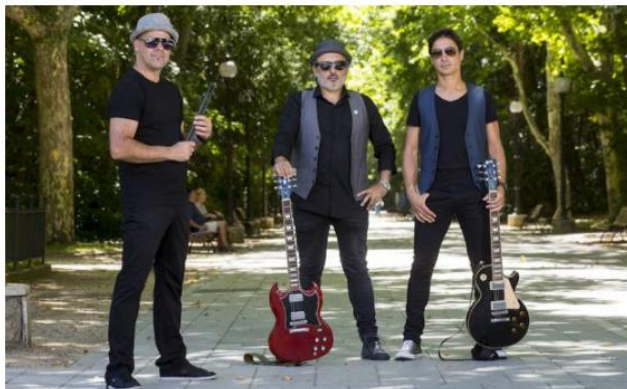
Los integrantes de La LinGa, en el Campo Grande.

Fue en septiembre del año pasado, en la Plaza Mayor, cuando La LinGa presentó 'Una vida sin calor', su segundo proyecto cultural «con el que queríamos crear un disco conceptual, en el que se contara la historia de una persona y que además fuese muy de Valladolid», asegura Duque. Una vez que tuvieron los objetivos claros, llegó 'El hereje' y los temas que este libro aborda: las relaciones, el amor, la fraternidad, la traición... Cuestiones que, igual que hicieron reflexiona a las personas en su día –tanto en el siglo XVI, como en los años noventa cuando se publicó la obra–, llegan a la actualidad sin aires de ser problemas de otro tiempo. «Lo que engancha del libro es que principalmente habla de cómo una persona afronta un montón de situaciones que tenemos cada uno de nosotros en nuestro día a día», asevera el vocalista de La LinGa.